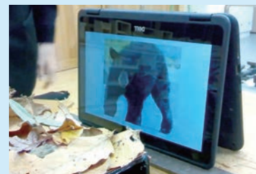
害獣被害対策製品

▼授業が円滑に行えるよう随時、無料レンタル・無料研修を行っています。詳しくは下記まで。