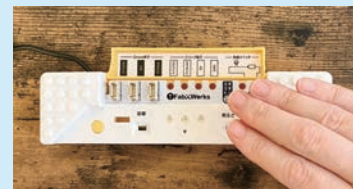
明るさの値の変化を確認

アクチュエーター他（LED・振動モーター・制御スイッチ）がどのように動くかを体験します。