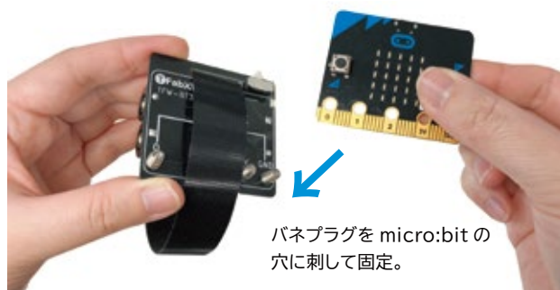
バネプラグを micro:bit の穴に刺して固定。